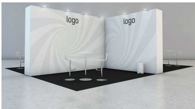
Beispiel Komplettstand ohne Optionen